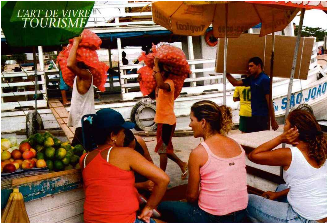
Sur le port de Tiradente, à Santarém, le va-et-vient des marchandises chargées à dos d'hommes est un spectacle d'un autre temps. En bas, les gigantesques nénuphars d'Amazonie aux fleurs blanches, roses ou violacées, ont colonisé un igarapé.