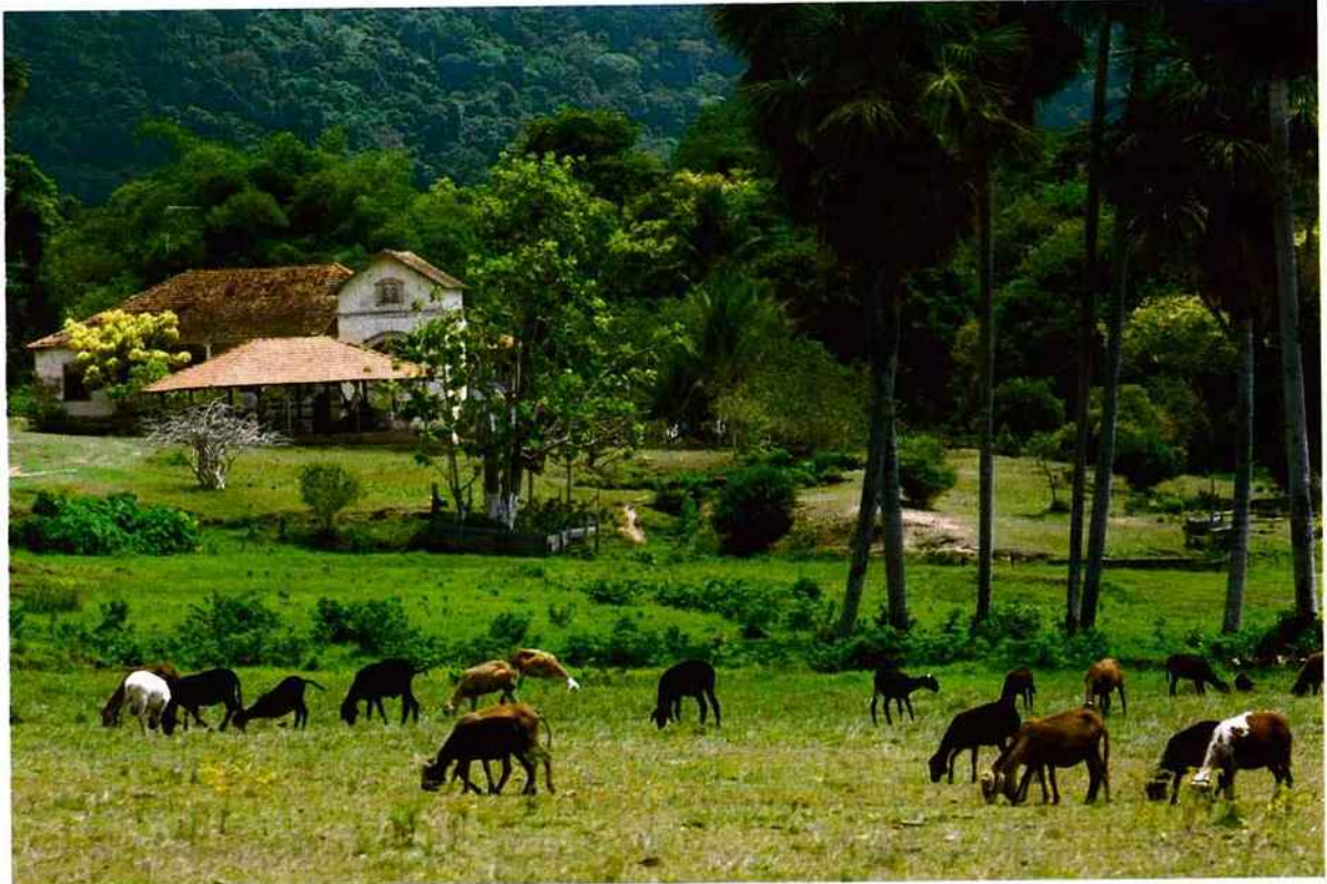
Côté Amazone, Taperinha révèle ses secrets. Sur les terres de cette exploitation qui alimentait Coca-Cola en sucre au XIX e siècle fut découverte la plus ancienne céramique des Amériques. Ci-dessous, escale sur le fleuve-mer à Monte Alegre.